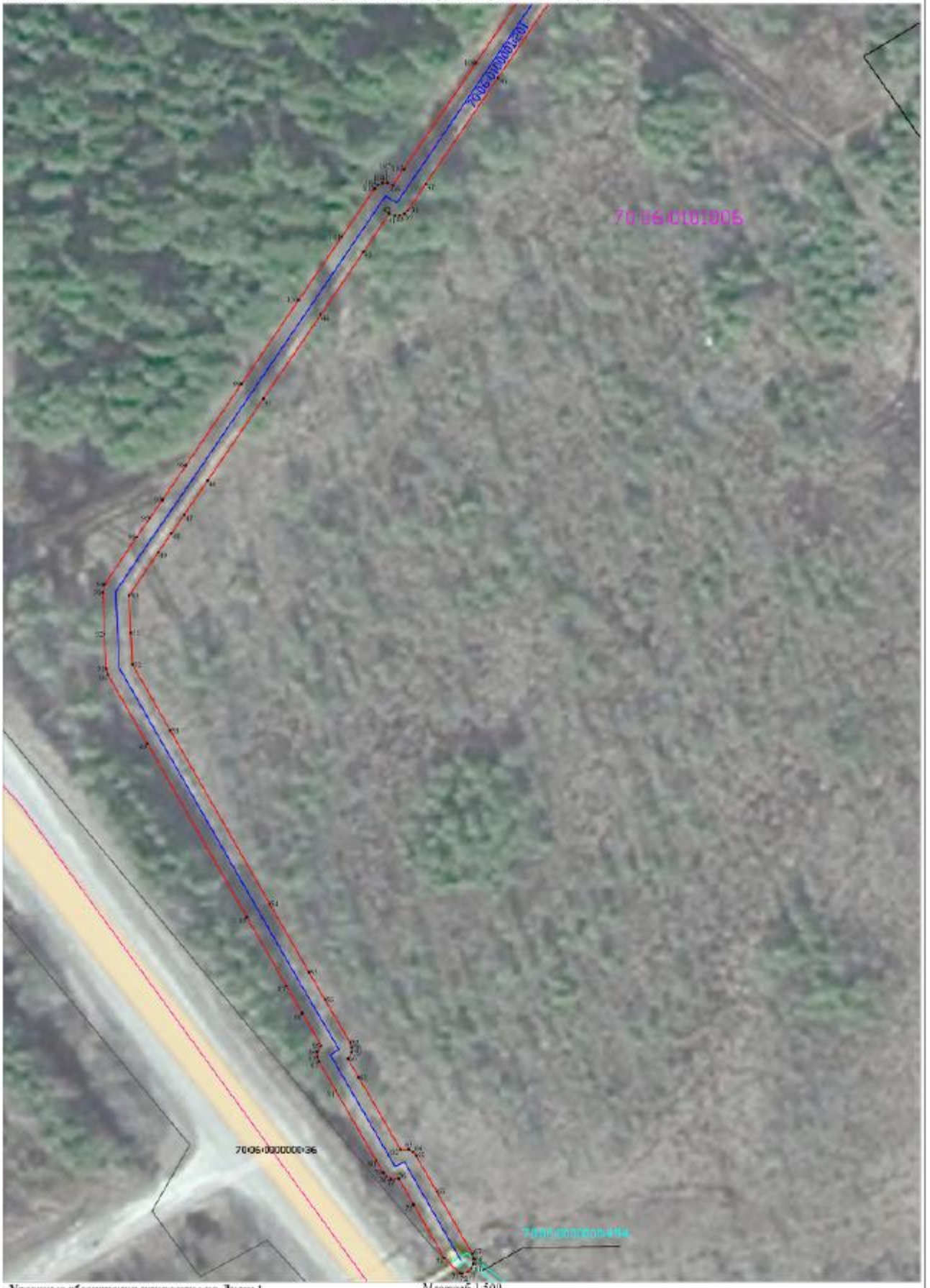
Схема расположения границы публичного сервитута