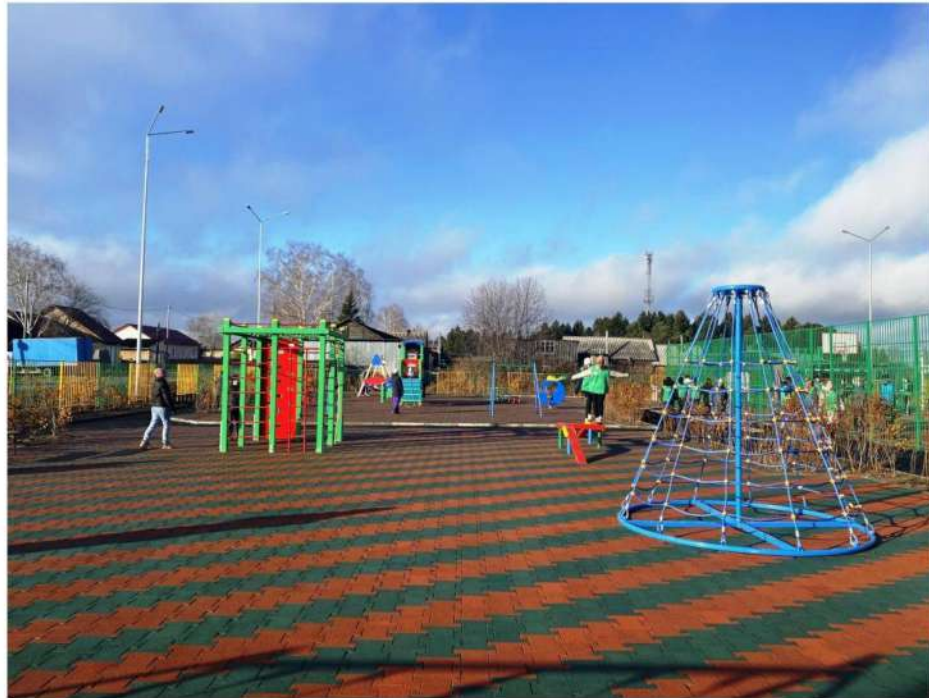
Детская игровая площадка